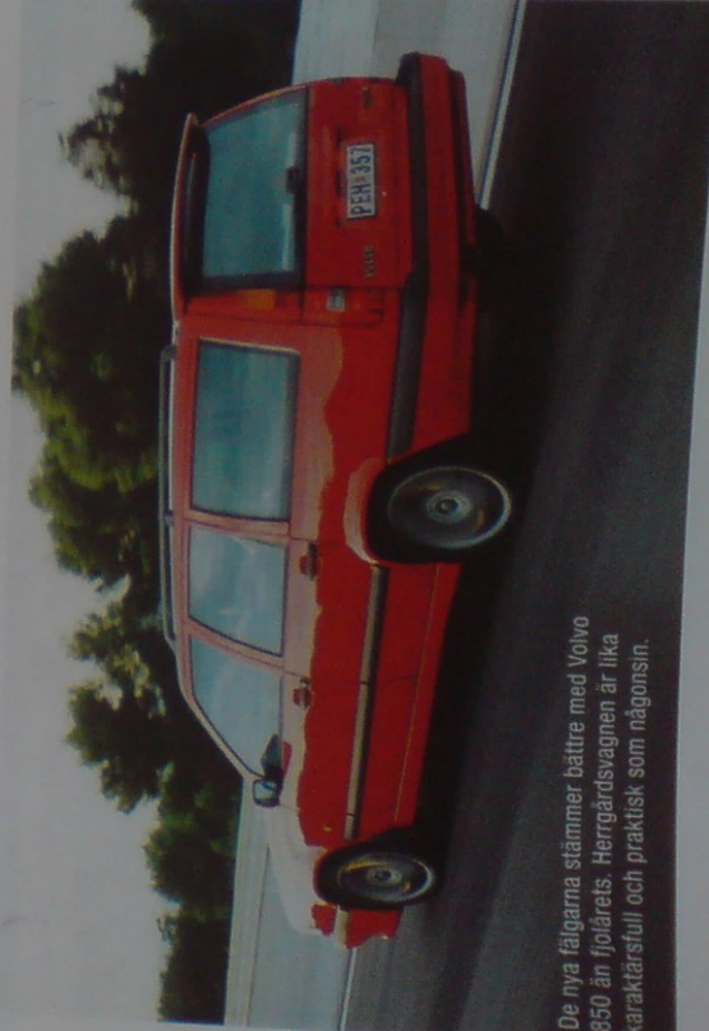
De nya fälgarna stämmer bättre med Volvo 850 än fjolårs. Herrgårdsvagnen är lika karaktärsfull och praktisk som någonsin.

Prestanda: acceleration 0-100 km/h 6,7 sek (aut 7,5 sek), toppfart 250 km/h (aut 240 km/h)